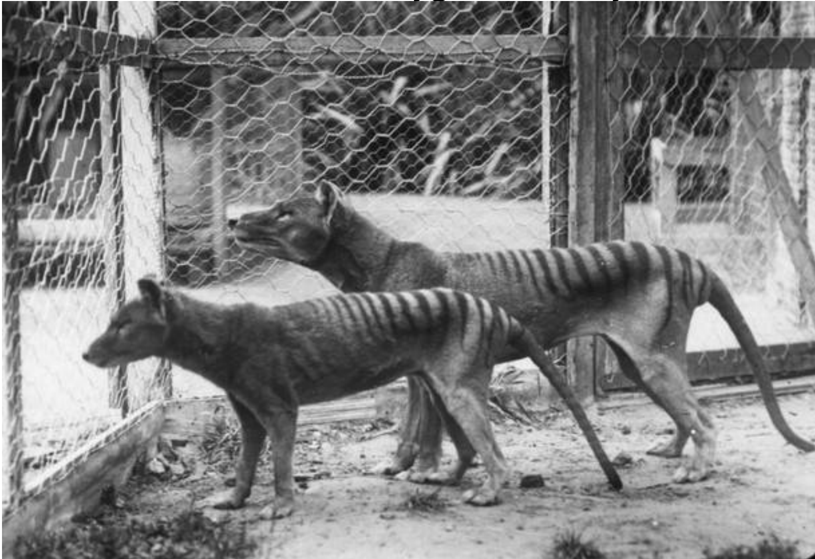
vyhynulý vačnatec z Austrálie