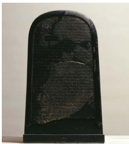
Fotografie rekonstruované Měšovy stély 4

V srpnu roku 1868 strávil německý misionář F. A. Klein 1 se svými společníky uvolněné odpoledne na návštěvě beduínského šejka arabského kmene Banū Hamīda v Dībānu. Nad hrnkem kávy se mu rozbušilo srdce, když se dozvěděl, že pár minut cesty odtud leží popsáný kamenný kvádr. O pár hodin později již stál před masivním čedičovým kamenem o rozměrech 2 115 × 60 × 60 cm. Kámen byl nahoře zakulacený a dole rovný. Pravý dolní roh byl rozbitý. Bylo vidět lehce vyryté písmo na třiceti čtyřech řádcích. Slova nápisu byla oddělena tečkami, delší větné celky svislými čarami 3 . Již se šerilo, a tak Klein nemohl pořídit opis nápisu, ale zapsal si jen několik znaků. Nebylo to mnoho, ale přesto nález kamene, který nechal zhotovit moábský král Měša kolem roku 850 př. n. l., vyvolal bouřlivý sled událostí.